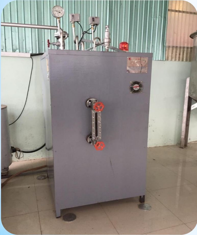
Nồi hơi đốt điện