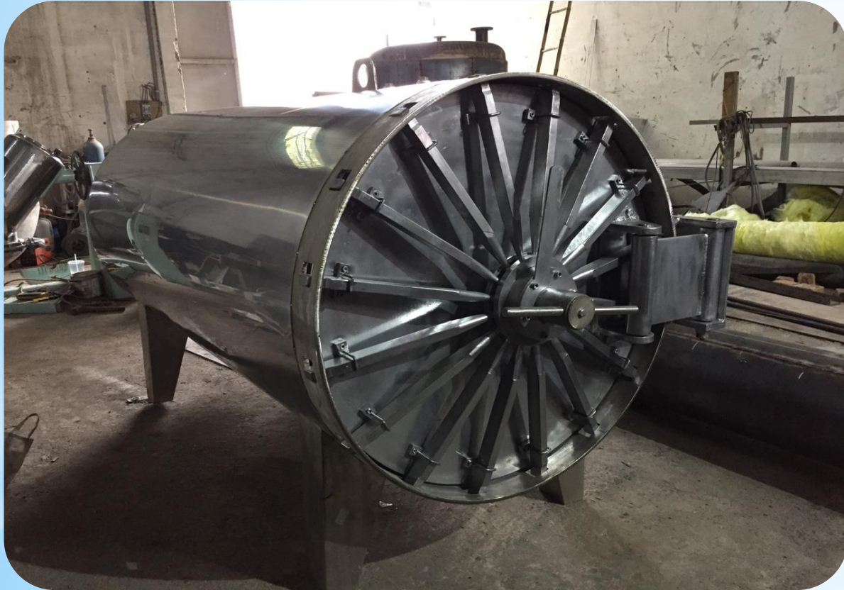
Nồi hấp 1.600 lít