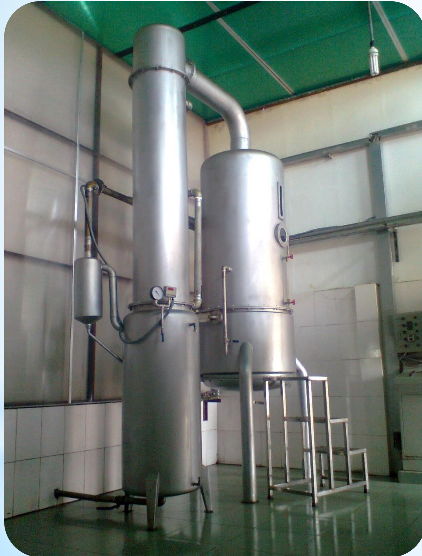
Lò hơi đốt dầu