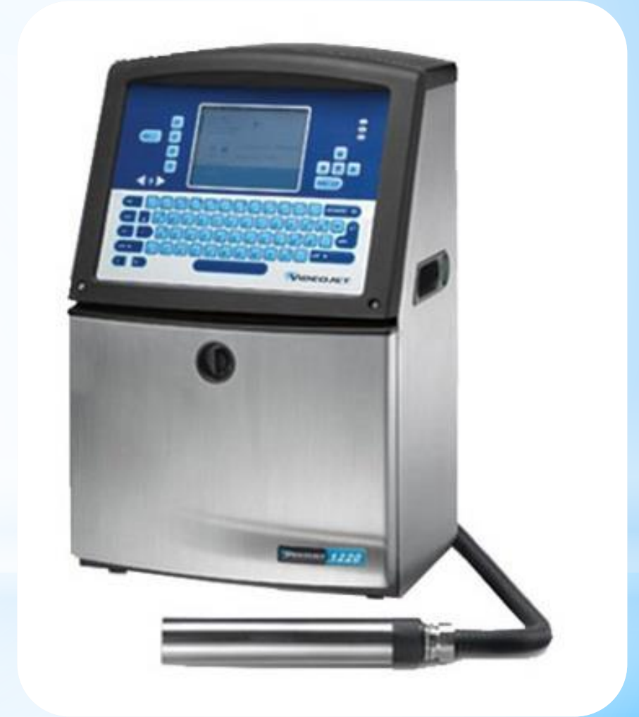
Máy in phun DATE tự động