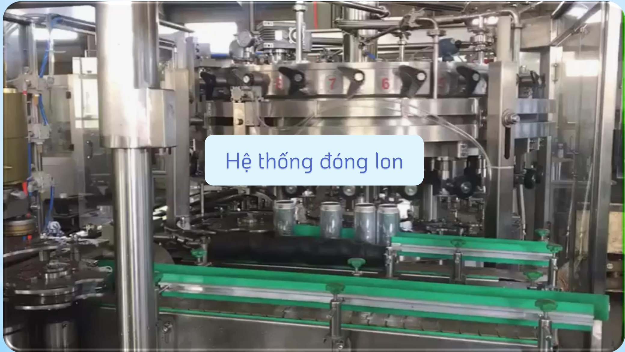
Hệ thống đóng lon