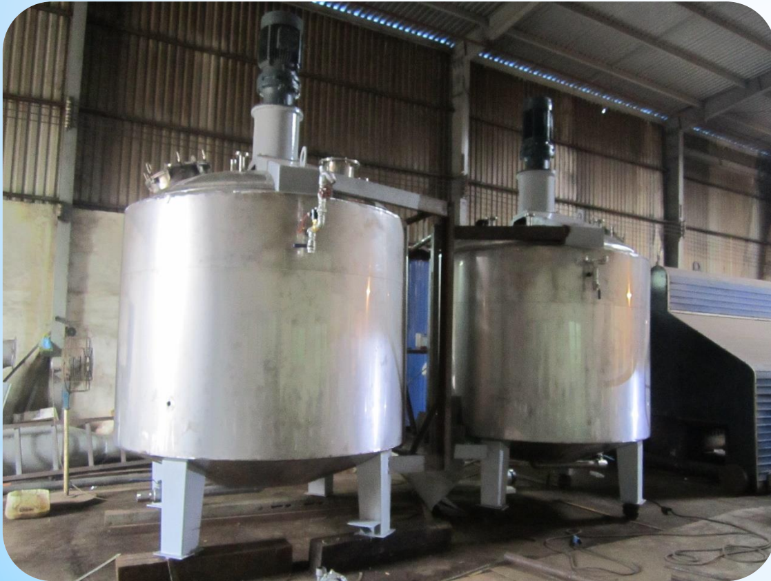
Nồi nấu hóa chất