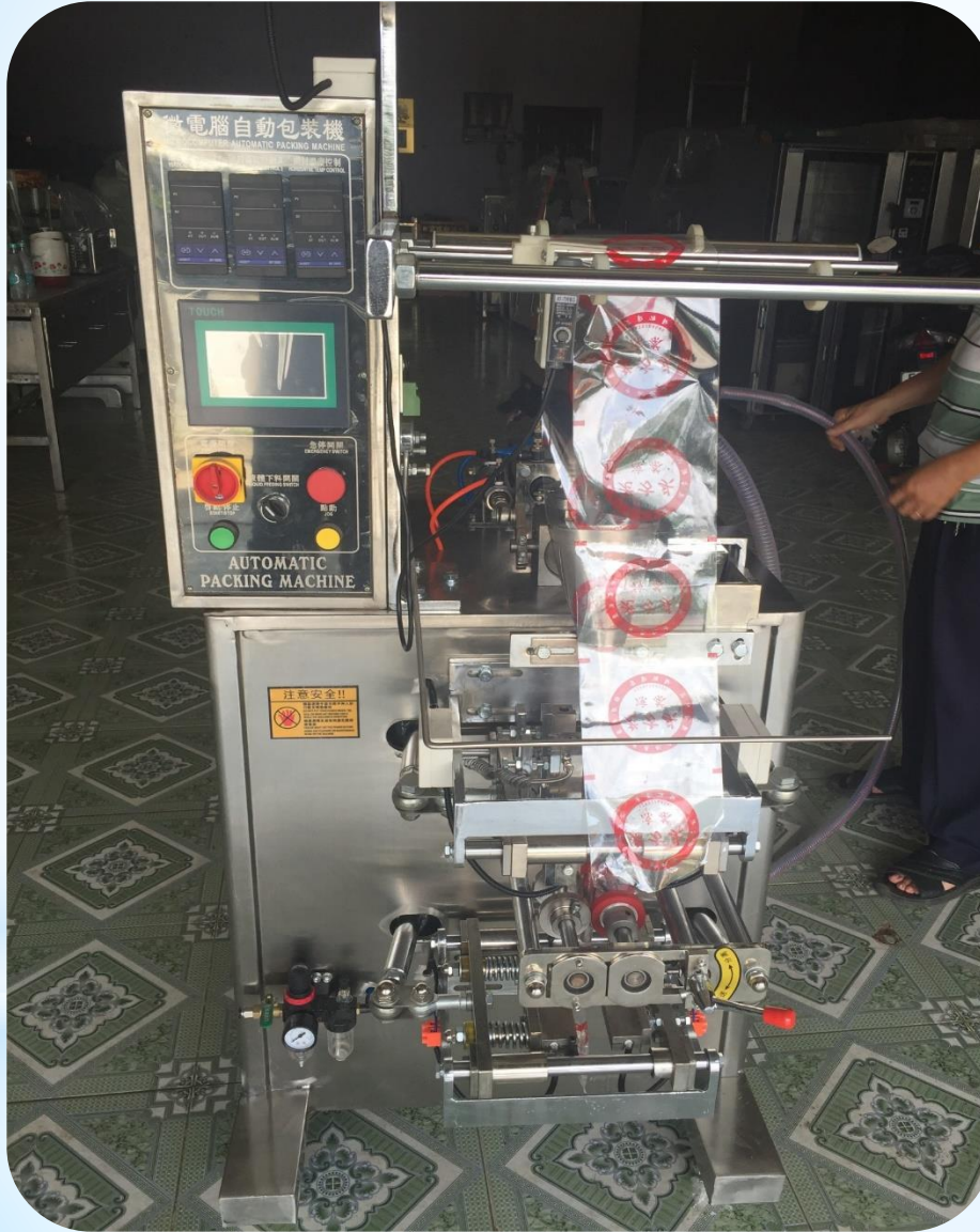
Máy dán nhãn